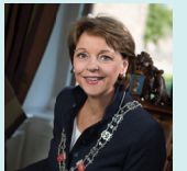
Burgemeester Elly Blanksma

Openbare Orde & Veiligheid, Bestuursjuridische Zaken en Kabinet & Protocol